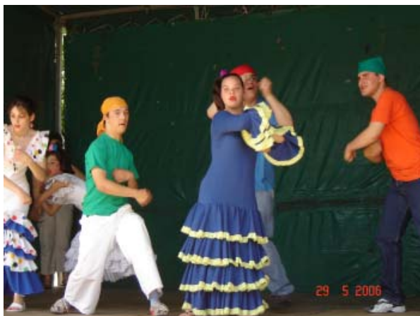
Alunos do CER

No dia 29 de Maio, o CER - Centro de Educação e Reabilitação da CERCIFAF , participou, a exemplo de anos anteriores, na Festa do Livro/ExpoEduca , iniciativa do pelouro da Educação e Cultura da Câmara Municipal de Fafe.