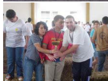
Equipa do CAO