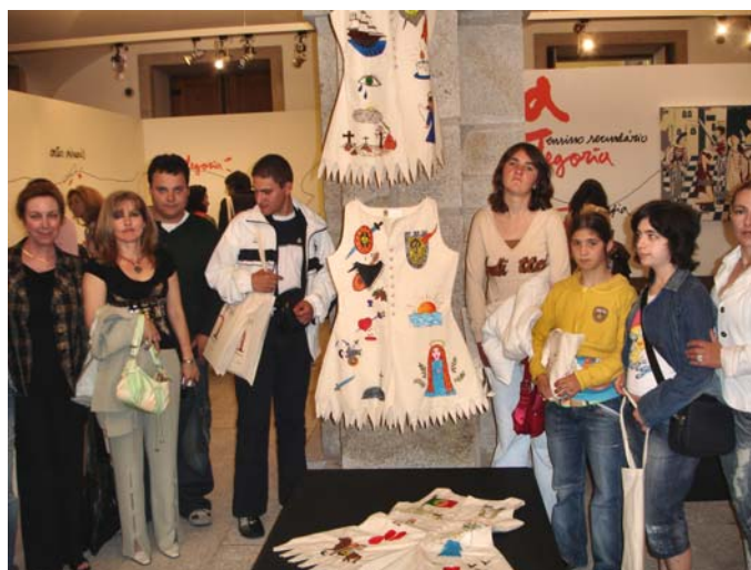
Trabalhos realizados por alunos do CER

O trabalho consistiu na execução de cinco Loudeis do rei D. João I, no domínio das artes visuais, por um grupo de seis alunos que obtiveram uma Menção Honrosa no 1º categoria do 1º ciclo. Também foi apresentada uma memória