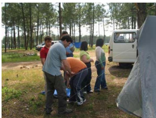
Grupo de participantes do CAO

Nos dias 13 e 14 de Maio, um grupo CAO da CERCIFAF acompanhado por dois técnicos deslocou-se até à Lousã, para participar num evento organizado pela ARCIL – Associação para a Recuperação de Cidadãos Inadaptados da Lousã , no âmbito das comemorações dos seus 30 anos.